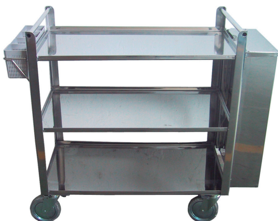
Carro Servicio Service Trolley Chariot de Service