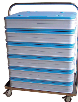
Carro Bandejas Isotérmicas Isothermal Trays Trolley Chariot pour Plateaux Isothermes