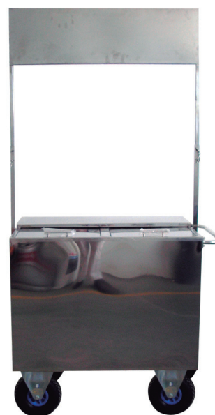
Carro Transporte Isotermos Isothermal Containers Transport Trolley Chariot de Transport de Récipients Isothermes