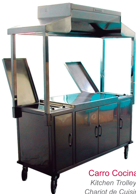
Carro Cocina Kitchen Trolley Chariot de Cuisine