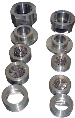
Perturbadores de Flujo

Flow Disturbing Plates • Perturbateurs de Flux